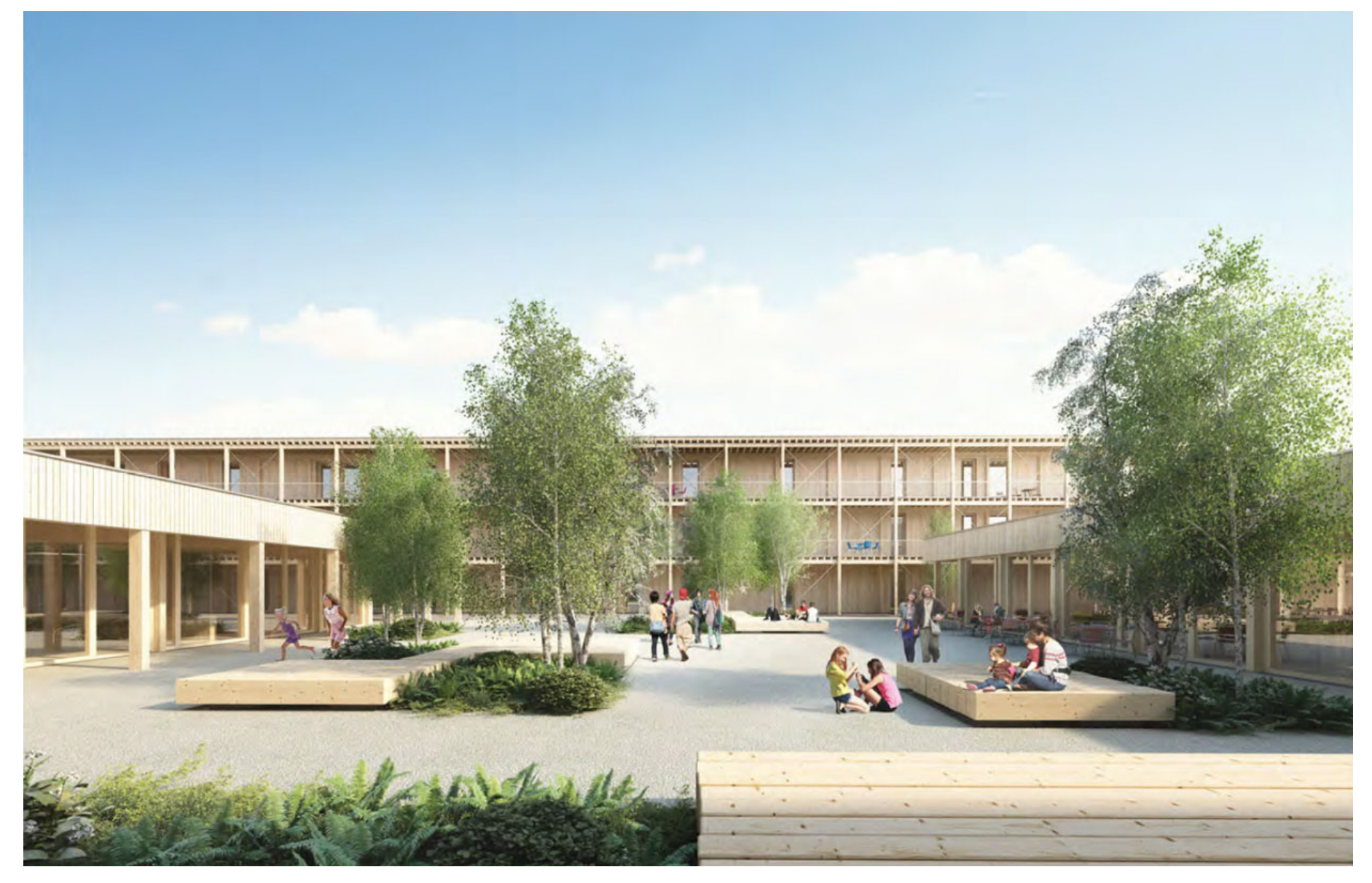
Ein «Dorfplatz» als Ort des Austauschs und der Begegnung

Die gute Nachricht ist, dass das mit dem ersten Rang ausgezeichnete Projekt von Ruprecht Architekten und Blumer Lehmann (Generalplaner) nicht nur «die beste Durchschnittsnote über alle Kategorien» erreichte, sondern auch auf der Ebene von Ausdruck und Bedeutung eine angemessene architektonische Antwort auf die herausfordernde Aufgabe fand. Unterstreichen Betrieb und räumliche Situierung des Neubaus nolens volens seine Sonderbarkeit, setzt der Entwurf von Ruprecht Architekten als Gegenreaktion auf freundliche Normalität. Weitere Qualitäten werden im Jurybericht gennannt: die einfache Gliederung in Administrationstrakt, Wohntrakt und eingeschossige Volumina für die Tagesaktivitäten (Betreuung, Verpflegung und Beschäftigung), welche gleichzeitig vielfältige räumliche Situationen innerhalb des Zentrums schafft, die Wegführung über den Aussenraum, der Laubengang, der genügend breit ist, dass er auch als Balkon in der Abendsonne dient etc.