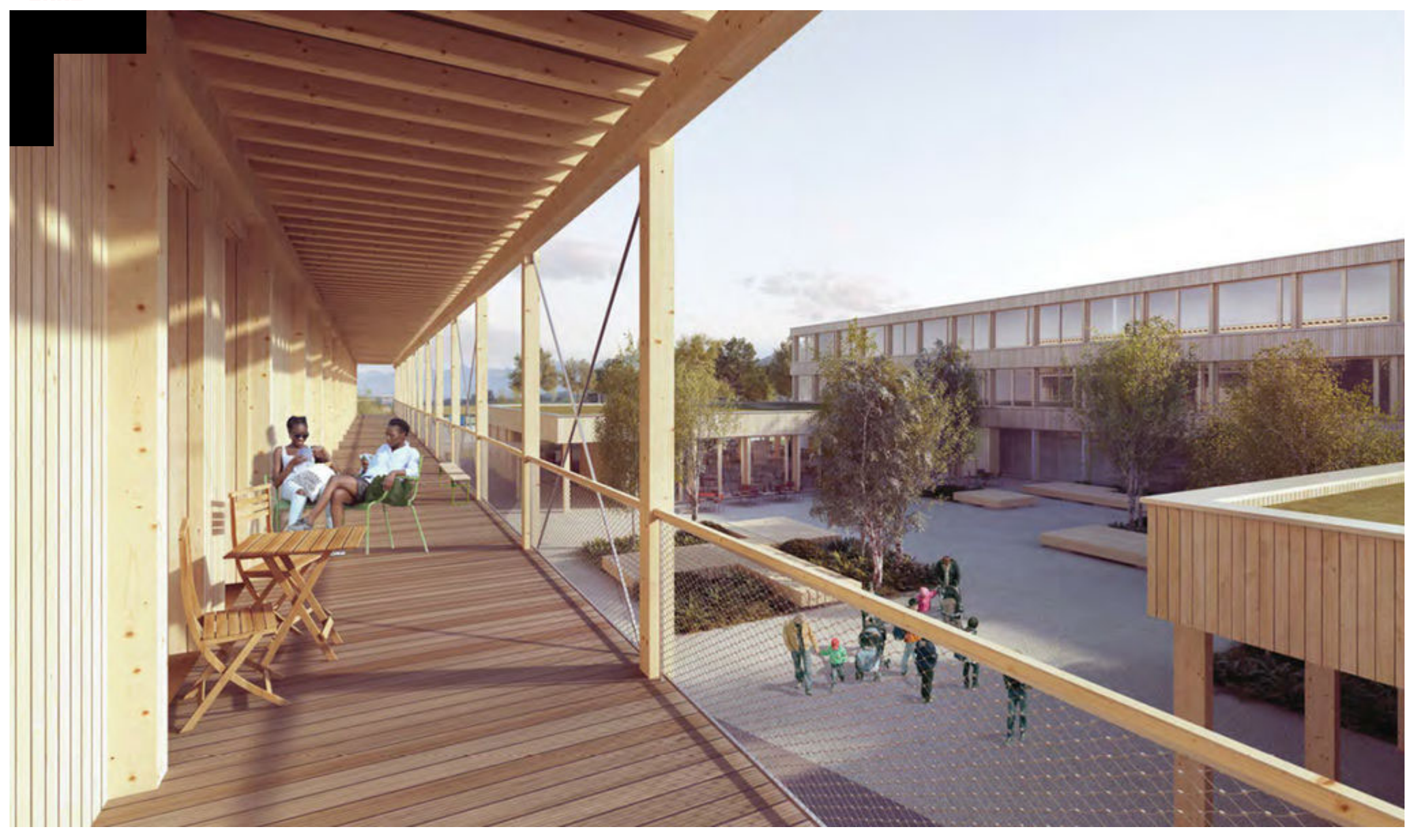
Trotz allem: Der Wohnbalkon bietet Ausblick und Rückzugsmöglichkeiten