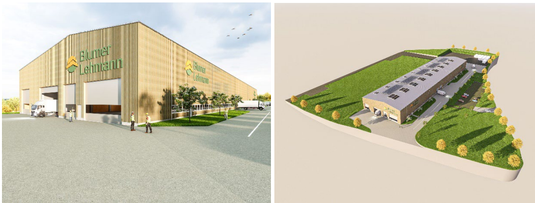
Visualisierungen der 1. Bauetappe des neuen Holz- und Modulbauwerks in Steinau an der Straße