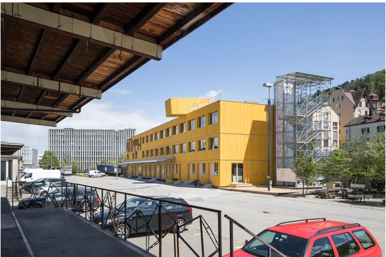
Das markante gelbe «Lattich»-Gebäude im Güterbahnhofareal

Mit Temporärbauten hat das Unternehmen grosse Erfahrung. In Kriens baute die Firma beispielsweise eine Asylsiedlung für 120 junge Flüchtlinge. Und in der Stadt St.Gallen baute die Blumer-Lehmann AG das «Lattich» beim Güterbahnhof oder ein Provisorium bei der Universität St.Gallen.