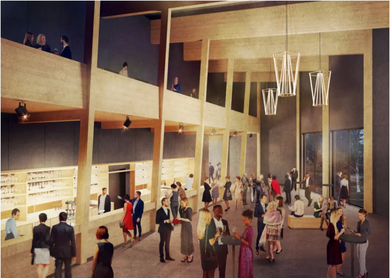
Visualisierung des Theaterprovisoriums