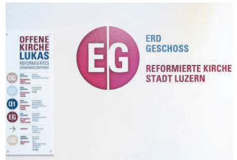
Bilder: Boris Bürgisser (Luzern, 25. Oktober 2019)

schäden in der Betondecke ist eine statische Unterstützung der Kirchentreppe im Foyer nötig. «Der Lukas war eine Wunderhilfe für uns», sagt Nicole Signer. Da wenig Dokumente und Pläne vorhanden gewesen seien, habe man vor der Planung zwar Sondagen durchgeführt. Die Stichproben seien aber für den Rest des Gebäudes nur teilweise repräsentativ gewesen.