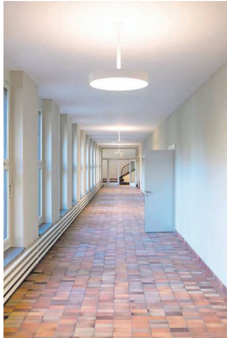
Der alte Klinkerboden (links) im Lukaszentrum wurde aufgerichtet, die Büros im Dachgeschoss (rechts oben) sowie die Signalisation (rechts unten) sind neu.

In den neuen Unterrichts- und Büroräumen im Gartengeschoss ist es dank Lichtschäch-