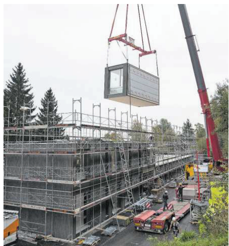
Ein Modul für das Grenzhof-Schulhausprovisorium wird vom Kran in die Höhe gehievt.