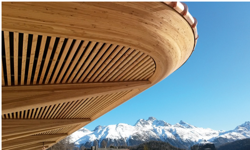
Einzigartige Dachkonstruktion aus Lärchenholz