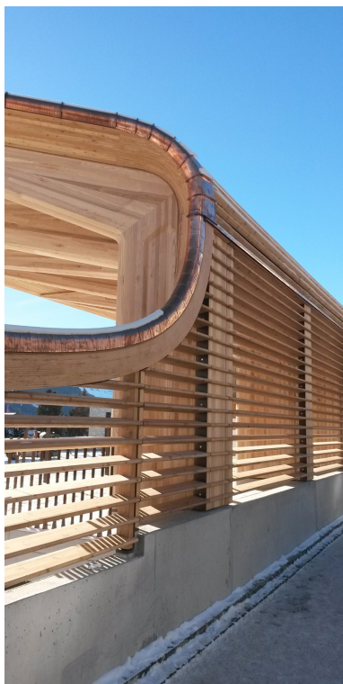
Tribünenabschluss gegen die Strasse