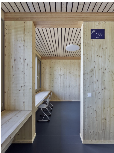
Viel sichtbares Holz im Innenausbau sorgt für ein angenehmes Raumklima.