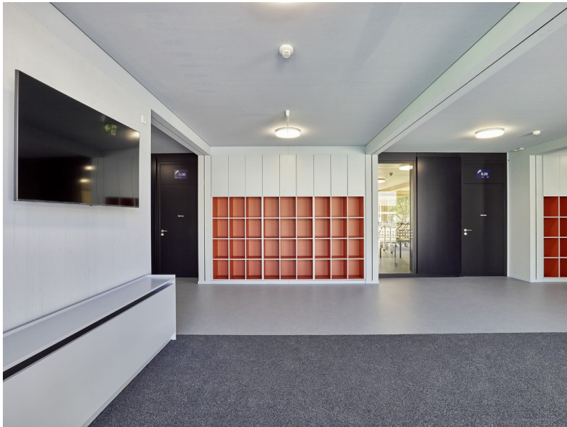
Einladend gestalteter Eingangsbereich mit Info-Screen