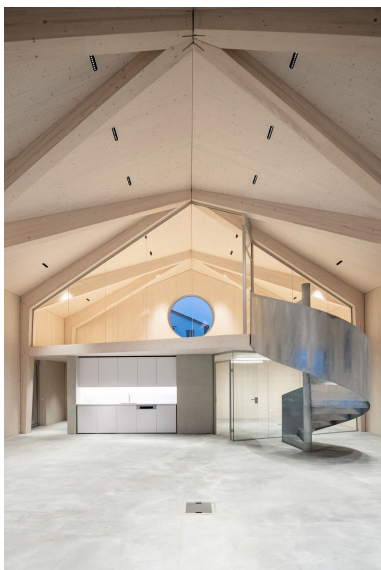
Büroraum mit Platz für 16 Arbeitsplätze sowie Meeting- und Workshopraum, Küche, Begegnungsraum und Stauraum.