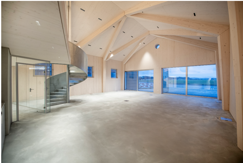
Büroraum mit Sicht auf eine ehemalige Startbahn des Flugplatzes