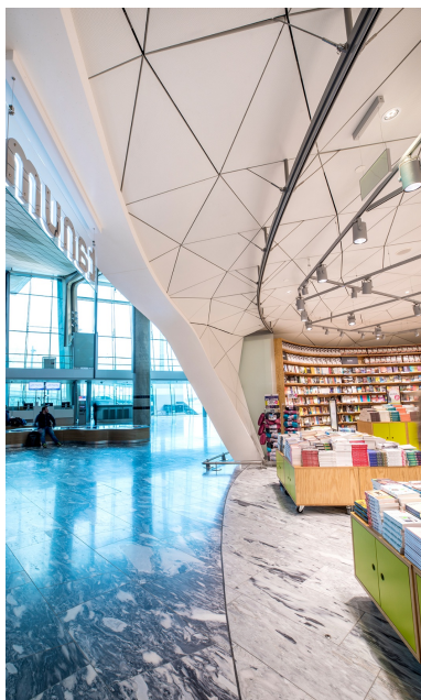
Detailansicht verkleidete Holzkonstruktion