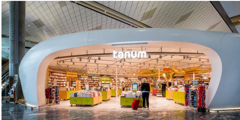
Pavillon im Transitbereich