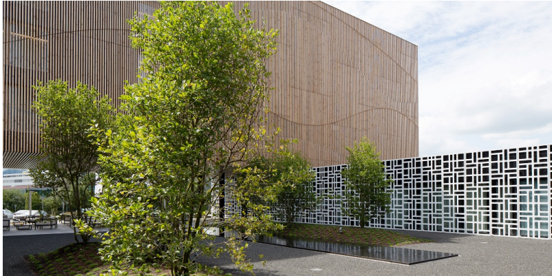
Fassadengestaltung mit vertikaler Douglasienlattung