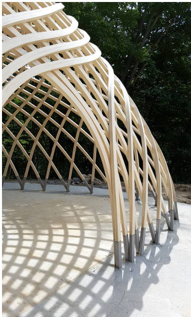
Detailansicht Free Form-Konstruktion