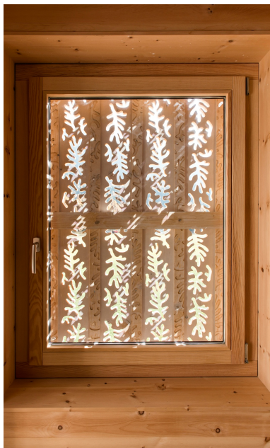
Ornamente der Fassade werden auch im Innenraum spürbar