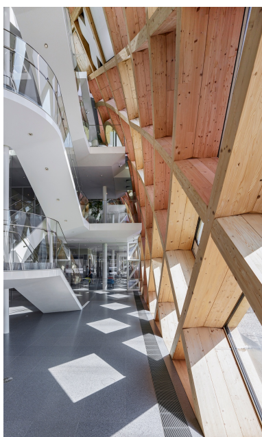
Aus 100% Schweizer Holz wurde die eindruckliche Holzgitterkonstruktion gefertigt