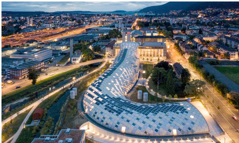
Die 240 m lange Schlange beisst sich ins Dach des Museumsgebäude Cité du Temps