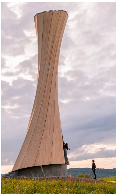
Eine Lärchenfassade umhüllt den Turm