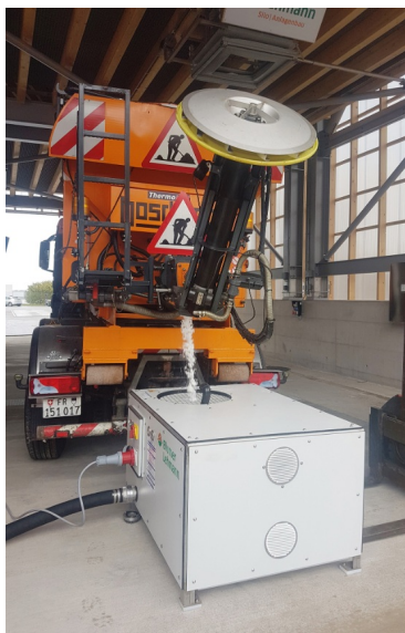
Modulsiloanlage für Streugüter in Fribourg