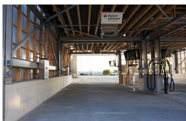
Mobile Salzurückförderanlage für Salzreste im Streufahrzeug