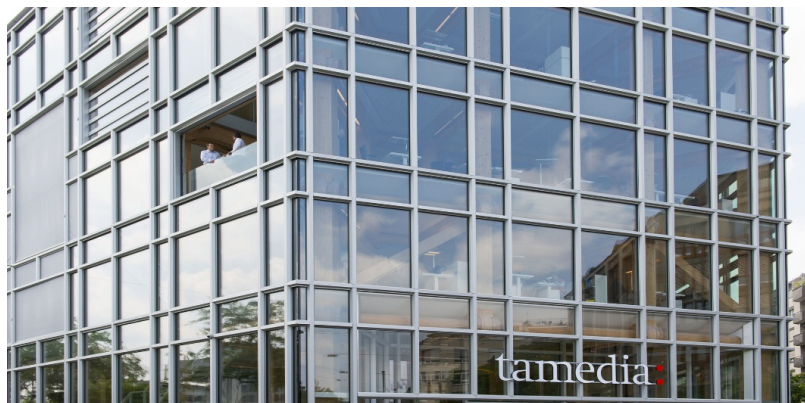
Immeuble de bureaux de 7 étages