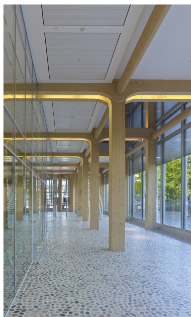
Structures porteuses apparentes à l'intérieur du bâtiment