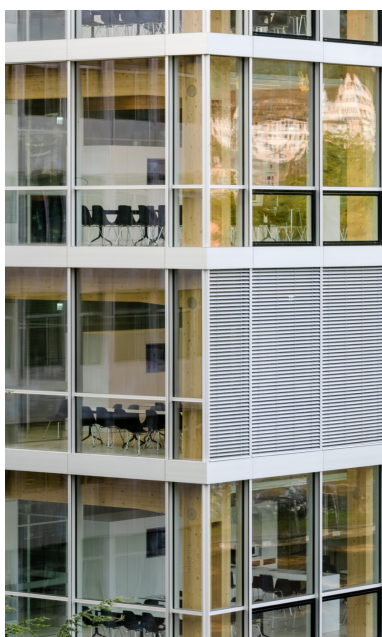
Vue de la construction à ossature bois