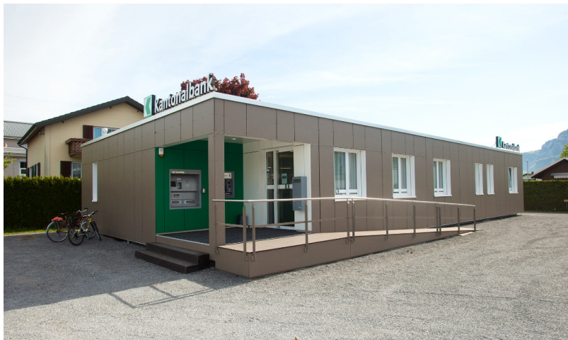
Entrée avec rampe d'accès pour fauteuils roulants