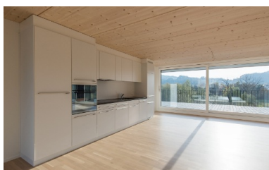
Salon très lumineux

info@blumer-lehmann.com blumer-lehmann.com