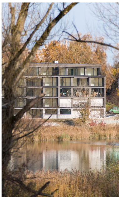
Construction en bois de 4 étages sur un socle massif