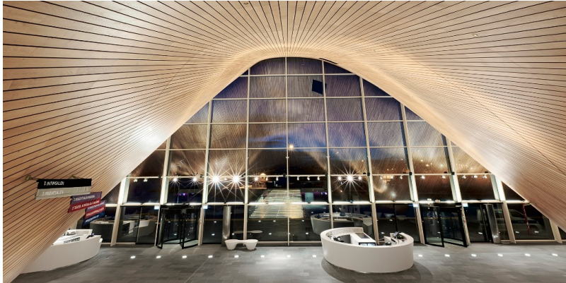
Toiture courbe à forme libre