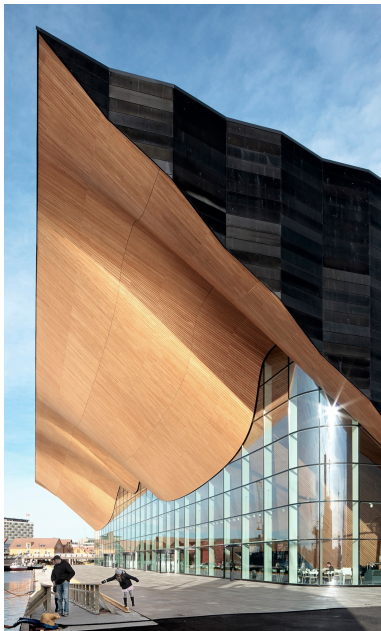
Vue latérale de la toiture avec raccordement à la façade vitrée