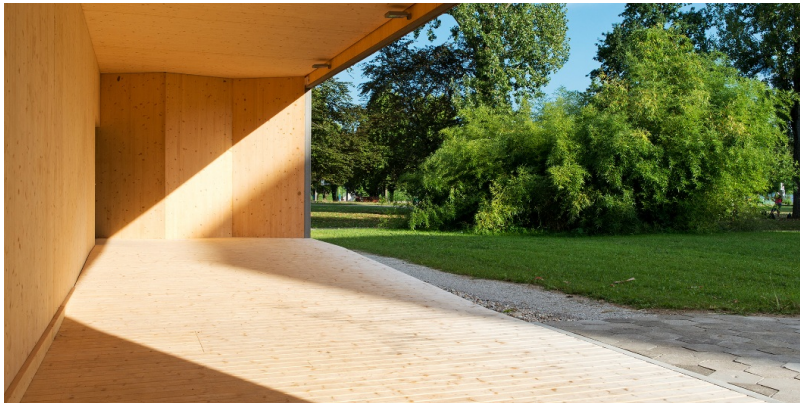
Hall d'entrée du Théâtre de Vidy