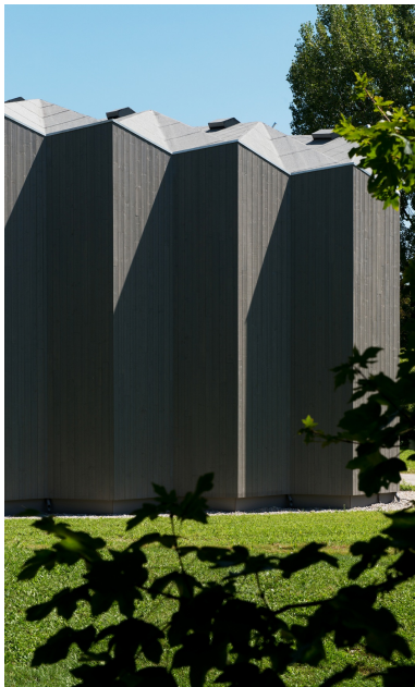
Structure porteuse qui semble «pliée»