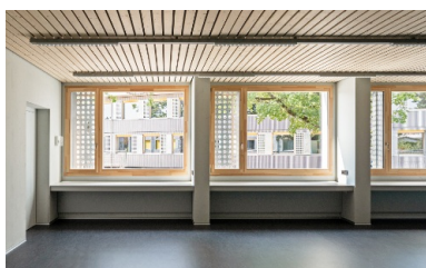
Les grandes fenêtres laissent entrer beaucoup de lumière naturelle dans les salles de classe.