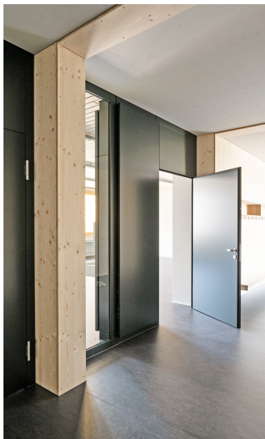
Zone d'entrée du pavillon scolaire construite en bois selon le standard Minergie Eco