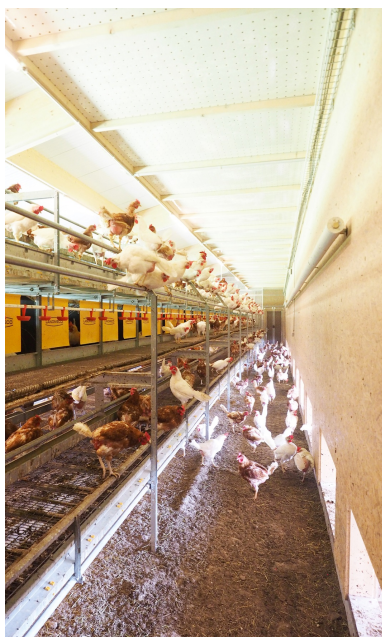
Beaucoup de lumière naturelle dans le poulailler