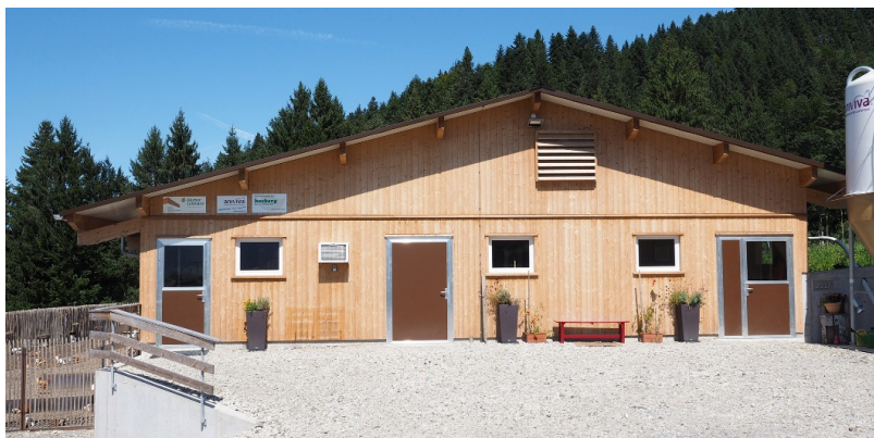
Façade avant avec bardage en sapin et épicéa