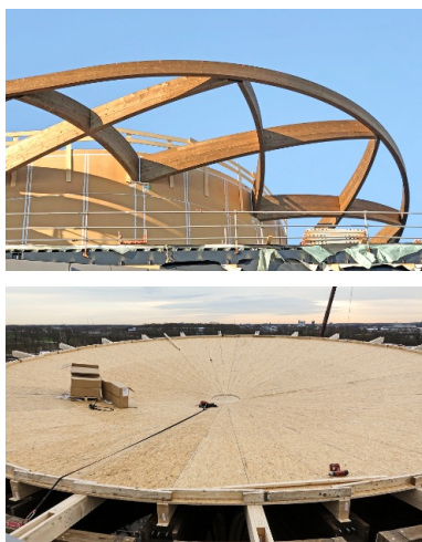
Vue détaillée de la construction du toit pendant les travaux de construction