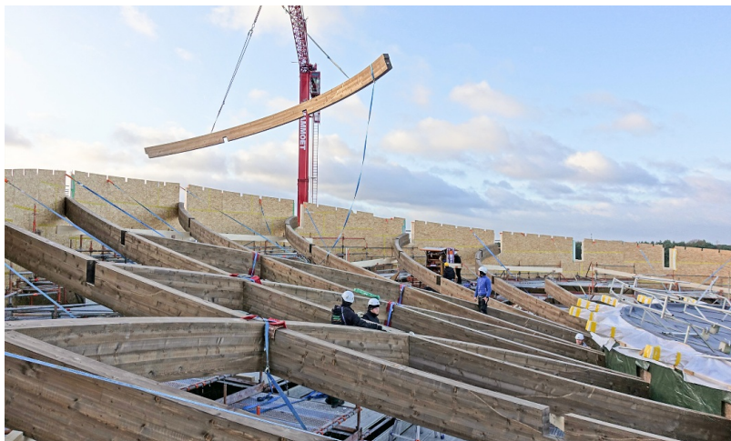
Travaux de construction de la structure porteuse.