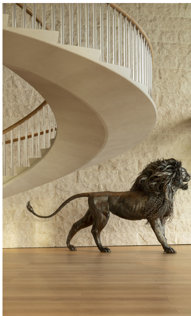
Design d'intérieur élégant