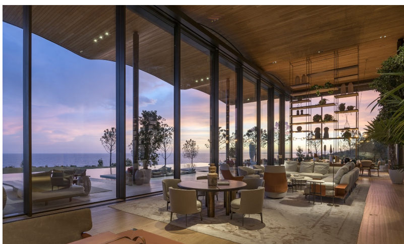
Intérieur spacieux avec vue sur la mer