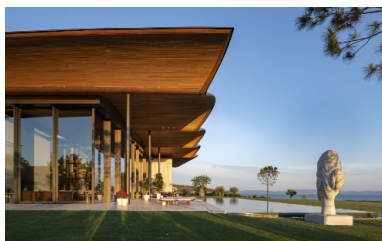
Le bois crée des contrastes sous une forme étonnante.