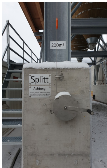
Plate-forme de toit galvanisée à chaud