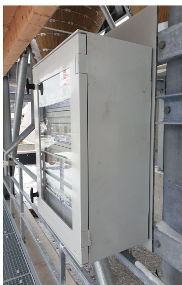
Plate-forme de service galvanisée à chaud