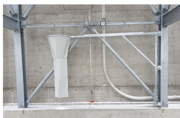
Col de remplissage